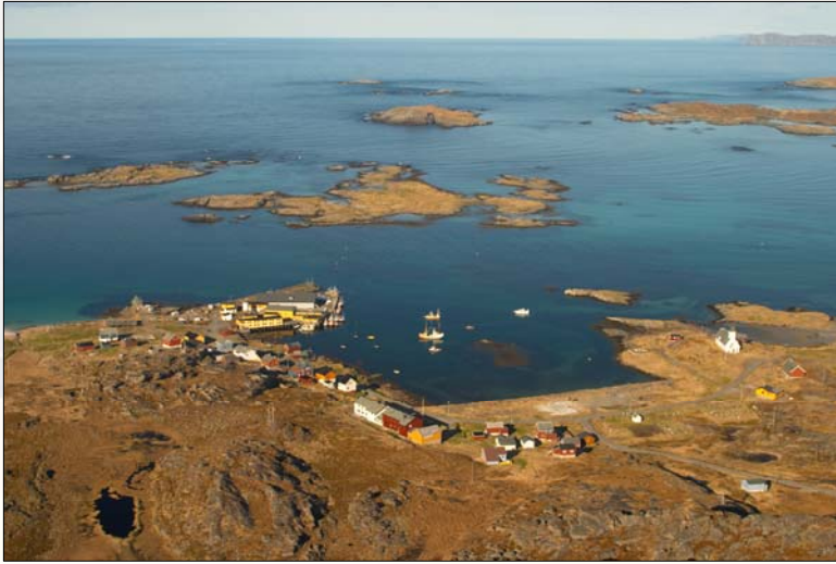
Bilde over: Ingøya. Bilde under: Ingøy tilbyr det aller ypperste av naturopplevelser/Outstanding nature experiences.