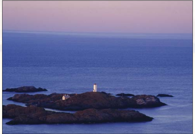
Bilde over:Fruholmen fyr, verdens nordligste bemannede fyr/Northernmost manned lighthouse.

12 senger/beds 2005 NOK 400–600 25 senger/beds 2006 NOK 400–600