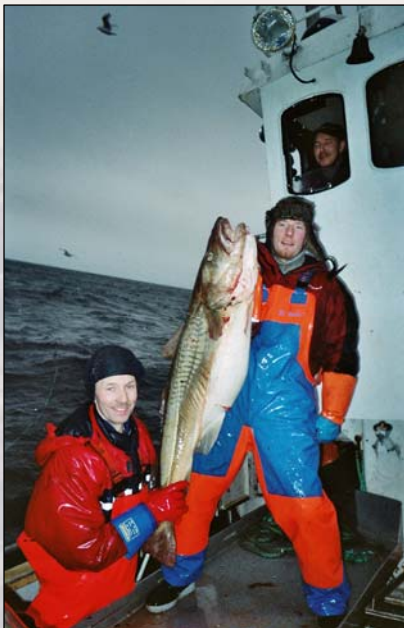
Bilde til venstre: Norges beste fiskefelt/ Best fishing areas in Norway.