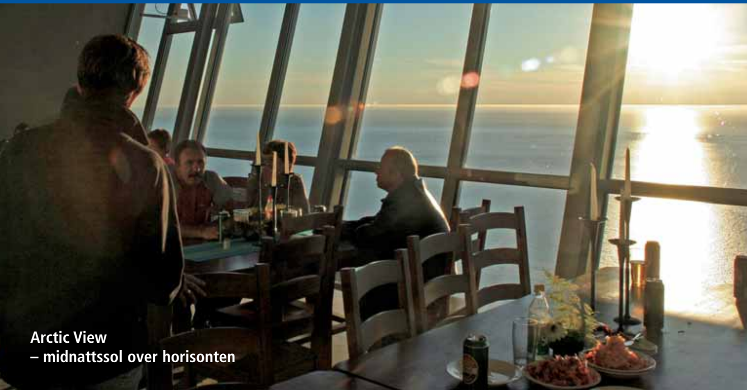
Arctic View – midnattssol over horisonten

Måsøy kommune ligger mot det ytterste nord på kysten av Vest-Finnmark med Nordishavet som eneste grense mot Nordpolen. Kommunen er en øykommune med nærmere 400 øyer, holmer og skjær.