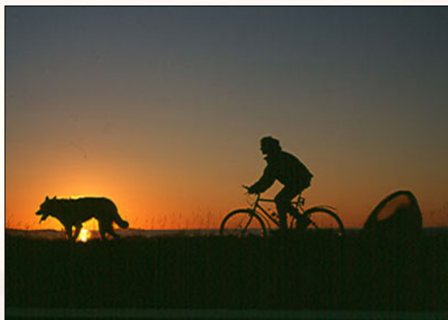
Bilde over: Fantastiske friluftsupplevelser/Spectacular outdoor activities.

Priser/prices: NOK 550 rom/room – 2500 hus/house.