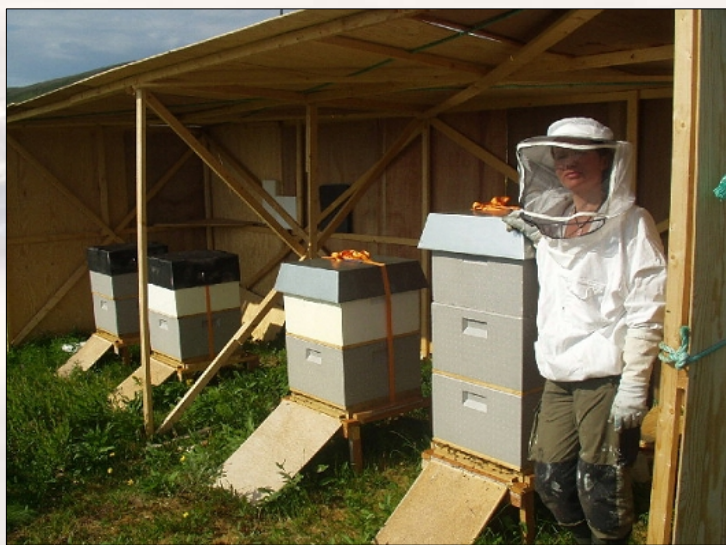
Bilde under: Verdens nordligste birøkteri/The northernmost beekeeping in the world.