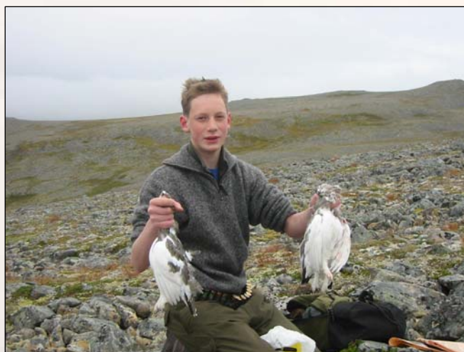
Bilde under: Rolvøya er kjent for å være en av de beste hare- og rypeøyene i Norge. Rolvøya is known to be one of the best hare- and grouse islands in Norway.

Rolvøya er en av Norges aller fremste jakt- og friluftssøyer. Her finner du også verdens nordligste birøkteri og spasenter. Rolvøya is one of the best islands for hunting and outdoor activities. Here are also the northernmost beekeeping and spasenter in the world.