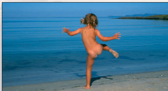
Bilde til høyre: Hva med å bade i kanten av Barentshavet? How about bathing at the edge of the Barents Sea?