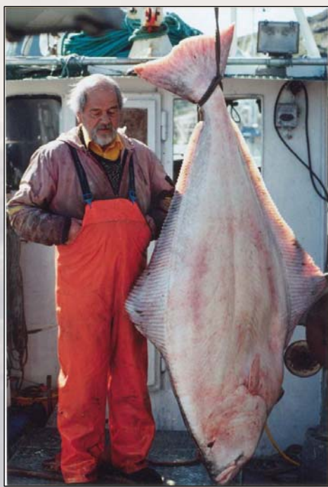
Bilde til venstre: Her kan du fange storfisken/You can catch the real big fish.